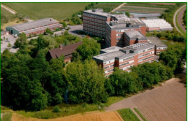
1978 – Heute: Nevinghoff 40, Münster