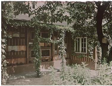
1925 – 1944: Südstraße. 76, Münster

Vor 90 Jahren, am 1. April 1925 wurde auf Bestreben des „Westphälischen Hauptvereins für Bienenzucht“ die Versuchs- und Lehranstalt für Bienenkunde an der Landwirtschaftskammer für die Provinz Westphalen gegründet.