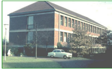
1952 – 1977: von Esmarchstr. 25, Münster